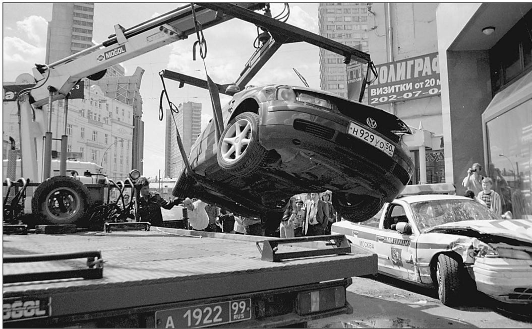
31 мая. Москва. Автомобиль, столкнувшийся с кортежем президента, восстановлению не подлежит