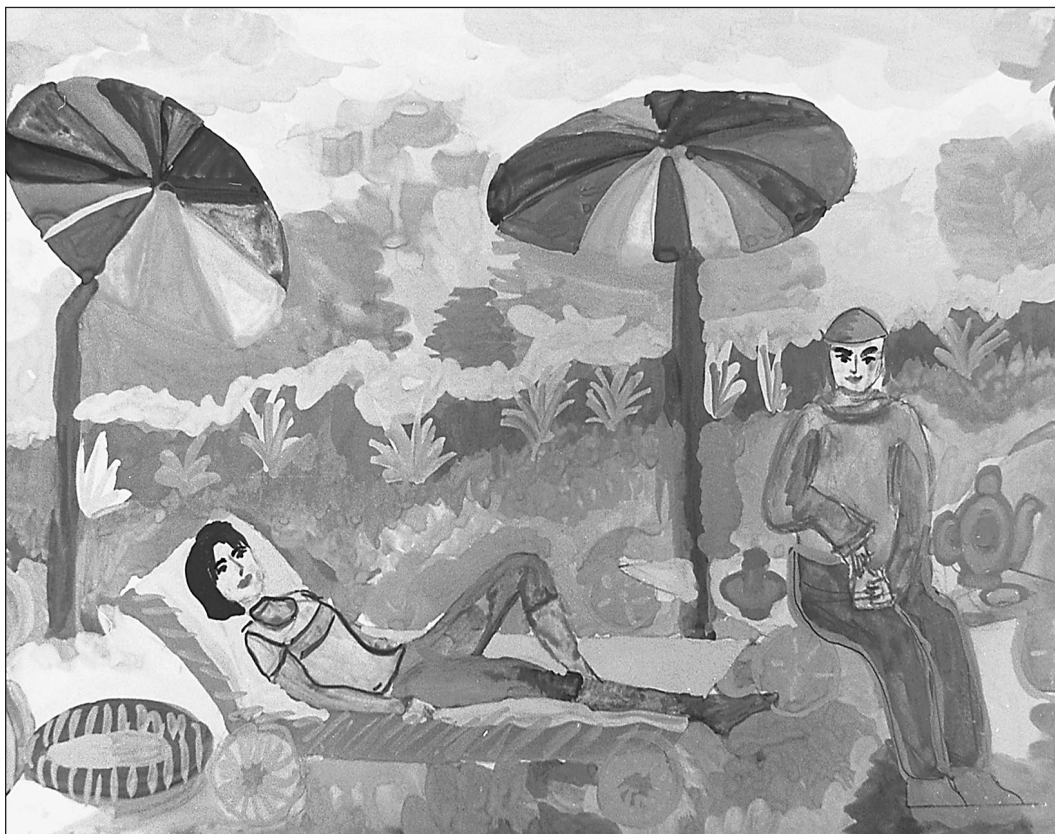
Рисунок «Золотое лето» Говорковой Кати из города Тольятти Самарской области

● ЦИТАТА ДНЯ «Каждый ребенок — художник. Трудность в том, чтобы остаться художником, выйдя из детского возраста». Пабло ПИКАССО