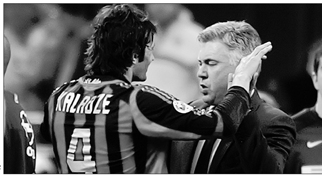
Карло АНЧЕЛОТТИ поздравляет Каху КАЛАДЗЕ с забитым голом.