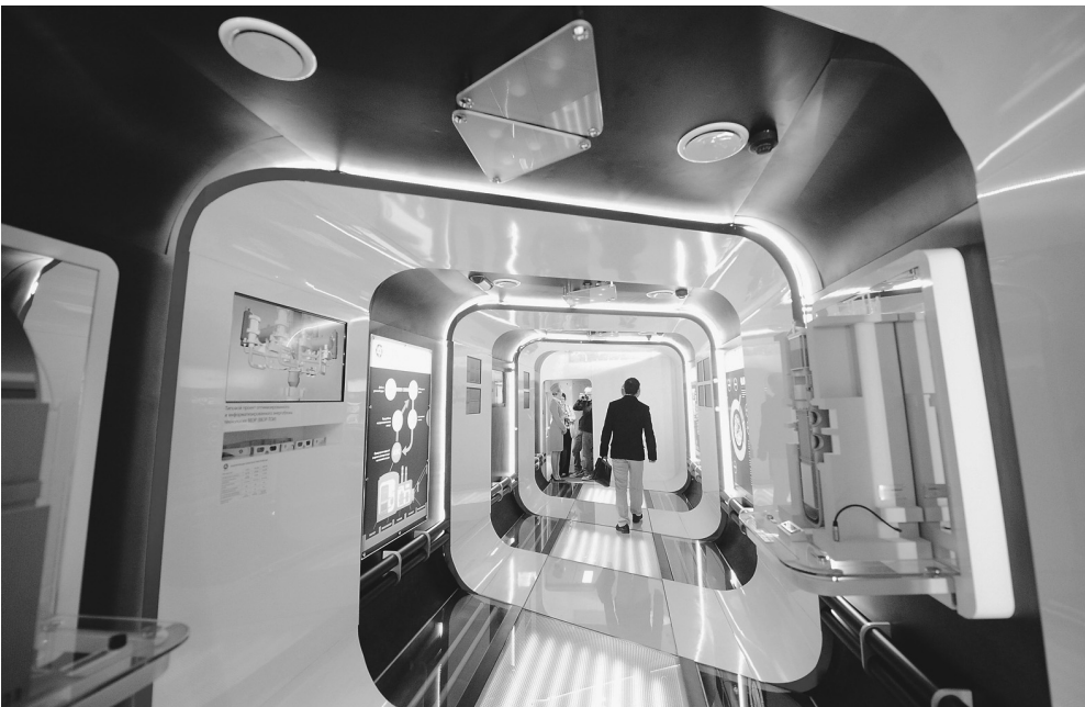
Футуристические интерьеры совместного творения «Российских железных дорог», корпорации «Роснано» и других госкомпаний должны создать для посетителей агитпоезда настроение будущего