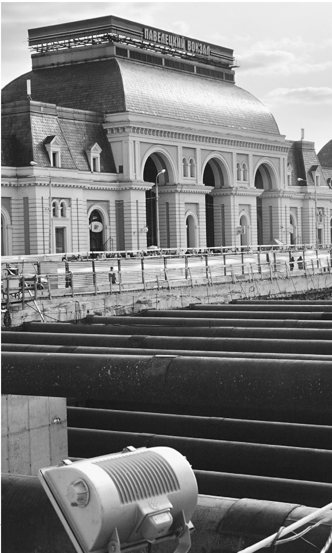
Павелецкий вокзал не разделит печальную судьбу Курского