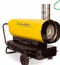
Дизельные пушки серий BHD / BHDN 10 • 20 • 36 • 63 • 105 / 21 • 52 • 80 кВт