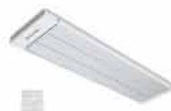
Инфракрасные обогреватели BHN 0,8 • 1 • 2 • 3 • 4 кВт