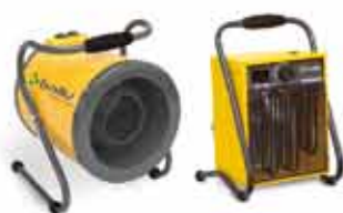
Электрические пушки серии PRORAB / MASTER 3 • 5 • 9 • 15 • 24 • 30 • 36 кВт