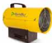
Газовые пушки серии BNG 10 • 18 • 38 • 57 • 81 кВт