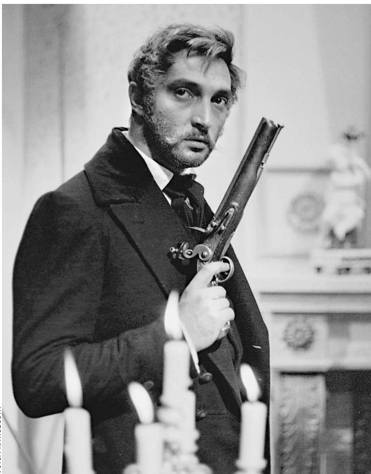
1966 год. В роли дуэлянта Сильвио в фильме «Выстрел»

— Да старший, конечно! Господи, он все такой же! Сарафанным радио новость разлетелась быстро. В тот же вечер в коридоре у отдельной палаты Козакова было установлено дежурство в надежде «случайно» встретить самого Михаила Михайловича. → стр. 9