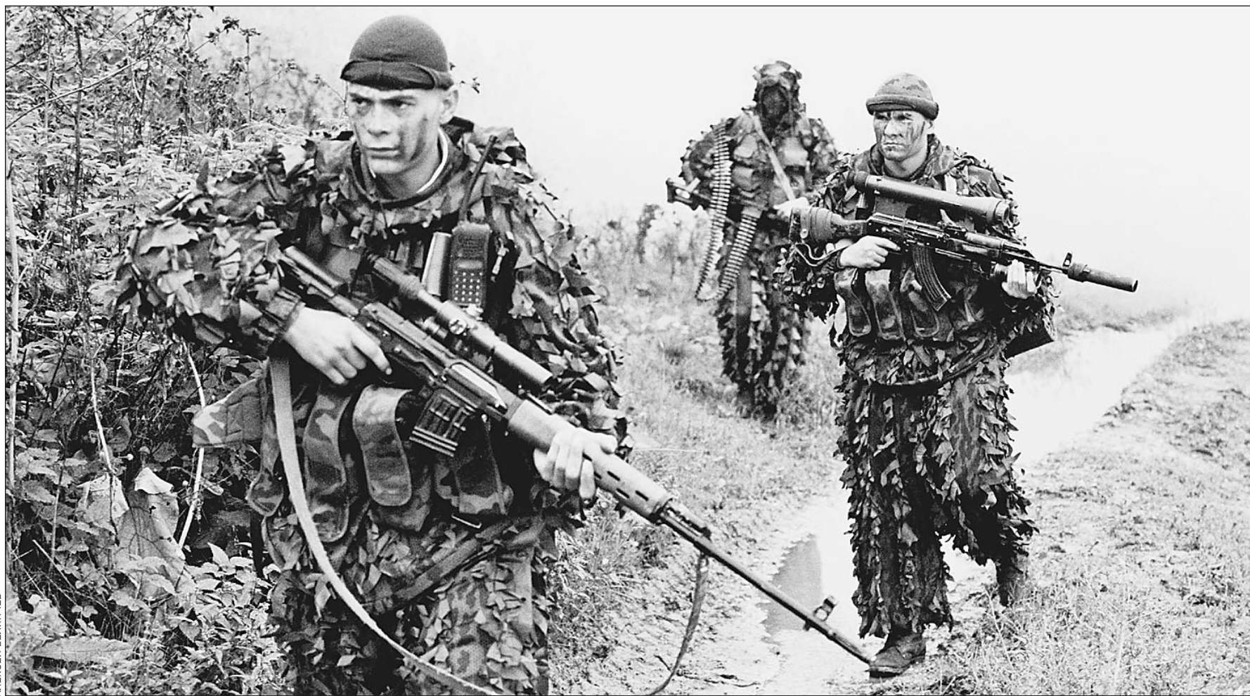
Чечня. Спецназ ведет охоту на полевых командиров

Вновь возникает фигура Аслана Масхадова — единственно возможного переговорщика со стороны сепаратистов. Как нельзя кстати в последнюю неделю появилось обращение новой «третьей силы» в Чечне, призывающей к переговорам с Масхадовым, а в Ингушетии объявили бессрочную голодовку беженцы, по странному стечению обстоятельств требующие того же. Общение с Масхадовым, пусть даже с позиции силы, под аккомпанемент требований о безоговорочной капитуляции, может быть кроме всего прочего серьезным внешнеполитическим шагом Москвы, поскольку Чечна осталась слва ли не единственной неурегулированной проблемой взаимоотношений между Россией и ЕС (если не считать ПРО). В Чечне сам факт консультаций федеральных властей с Масхадовым приведет к автоматическому успокоению части населения, ибо авторитет экс-президента все еще высок в ряде районов и среди нескольких тайпов Чечни.