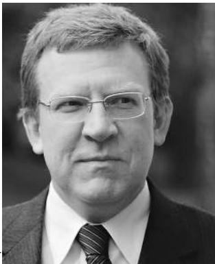
Алексей Кудрин оставил свою обычную осторожность

Нужно отметить, что это уже не первое перекраивание в позитивном смысле бюджета в этом году. В мае законодатели одобрили поправки, согласно которым дефицит планировался на уровне