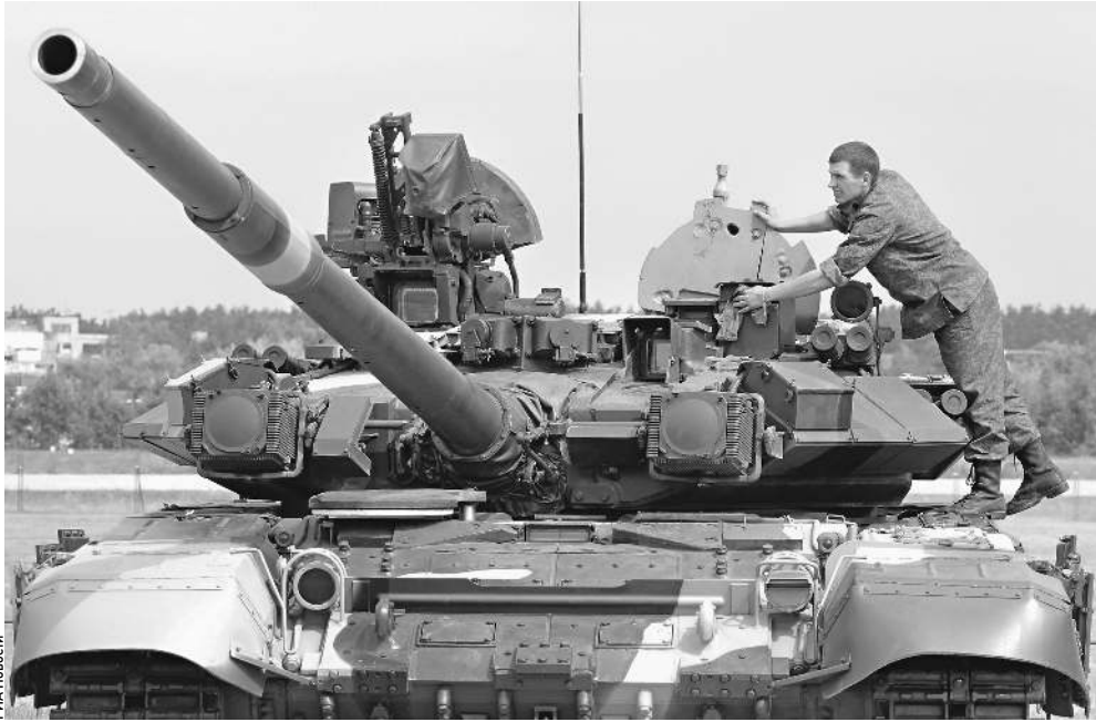
Новая башня, оснащенная усовершенствованной системой управления огнем и автоматом заряжания, дистанционно управляемым пулеметом и защитой, может увеличить привлекательность семейства Т-90