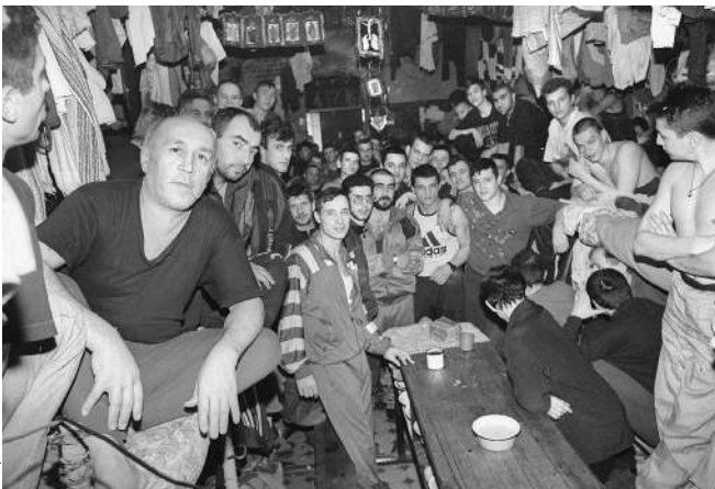
Перенаселенность камер — дополнительный повод для конфликта