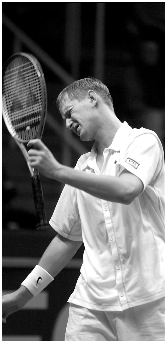
Вчера. Мальме. Евгений КАФЕЛЬНИКОВ.