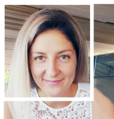
Госкопоран, кулинарный Злогер