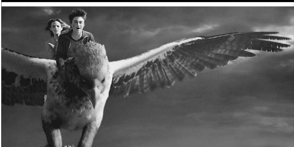
Фантастический зверь выручает Гарри со товарищи