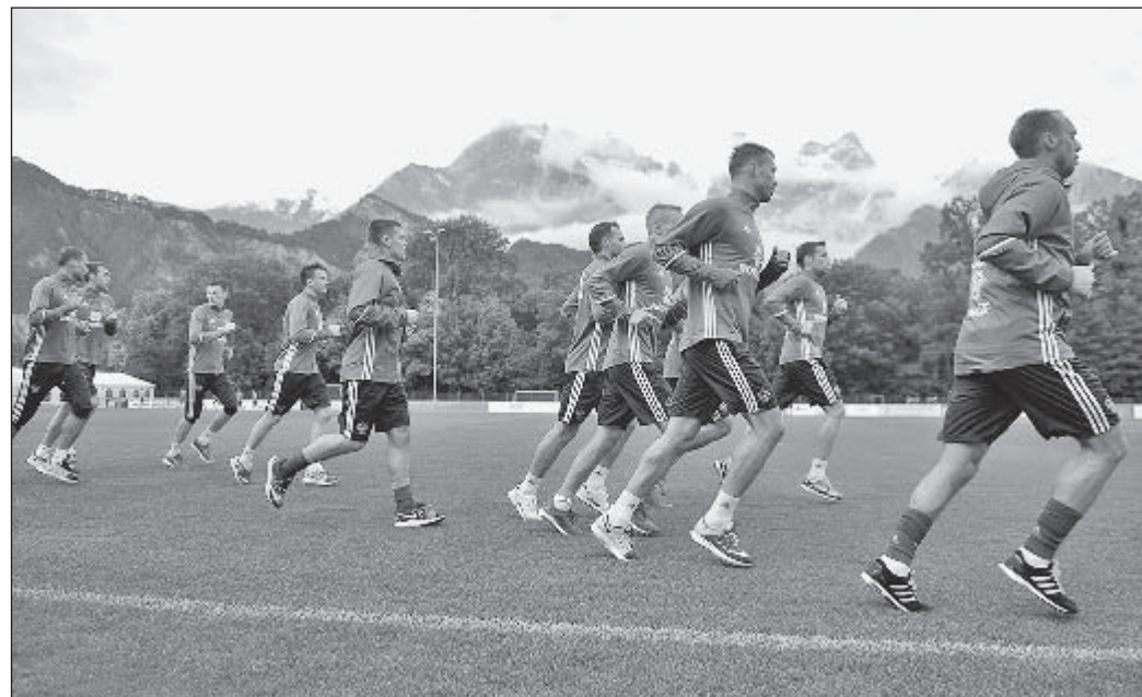
Вчера. Бад Рагац. Тренировка сборной России.

Вчера сборная России прилетела в Швейцарию на сбор в рамках подготовки к чемпионату Европы. Первую тренировку в команде Леонида Слуцкого провел новичок, русский немец Роман Нойштедтер.