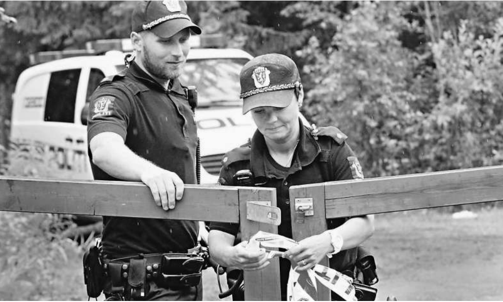
Теперь ферма с подмоченной репутацией находится под постоянным контролем полиции