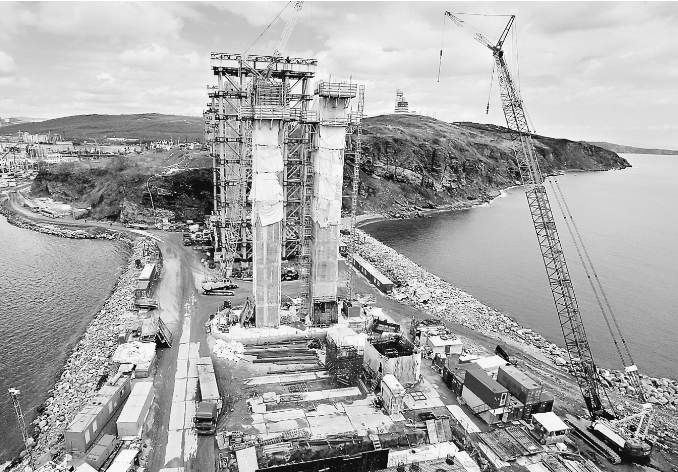
Чем грандиознее стройка, тем грандиознее ошибки в проекте