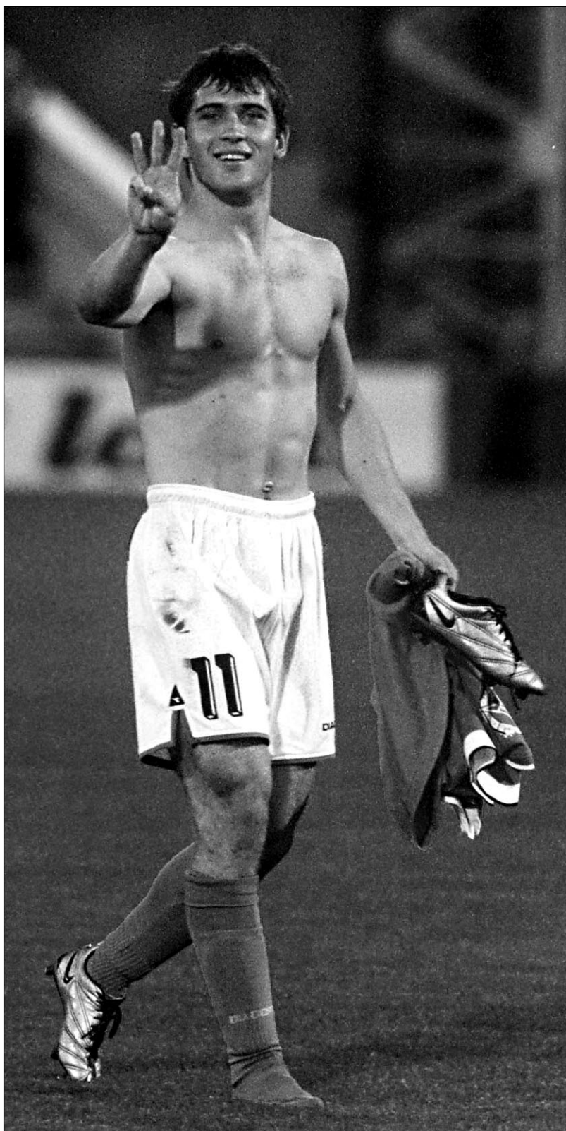
Суббота. Элиста. Стадион «Уралан». «Уралан» - «Зенит» - 3:3. Нападающий «Зенита» Александр КЕРЖАКОВ демонстрирует фотокорреспондентам, сколько голов он забил в этом матче.