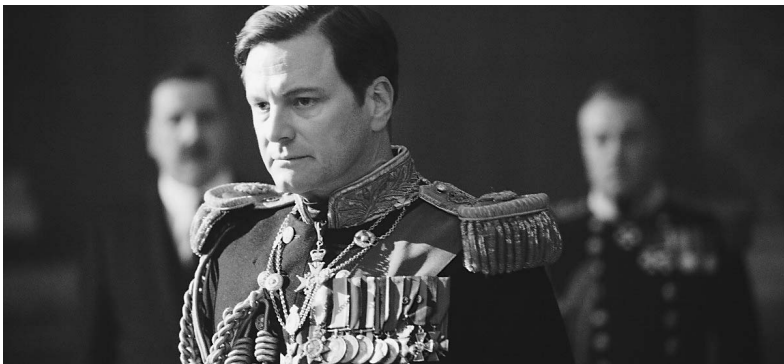
Король Великобритании Георг VI (Колин Фёрт, «Король говорит!»)

В ночь на 28 февраля в Лос-Анджелесе будут вручены премии Американской киноакадемии. Наибольшее количество номинаций у двух картин — «Король говорит!» Томаса Хупера и «Социальная сеть» Дэвида Финчера →09