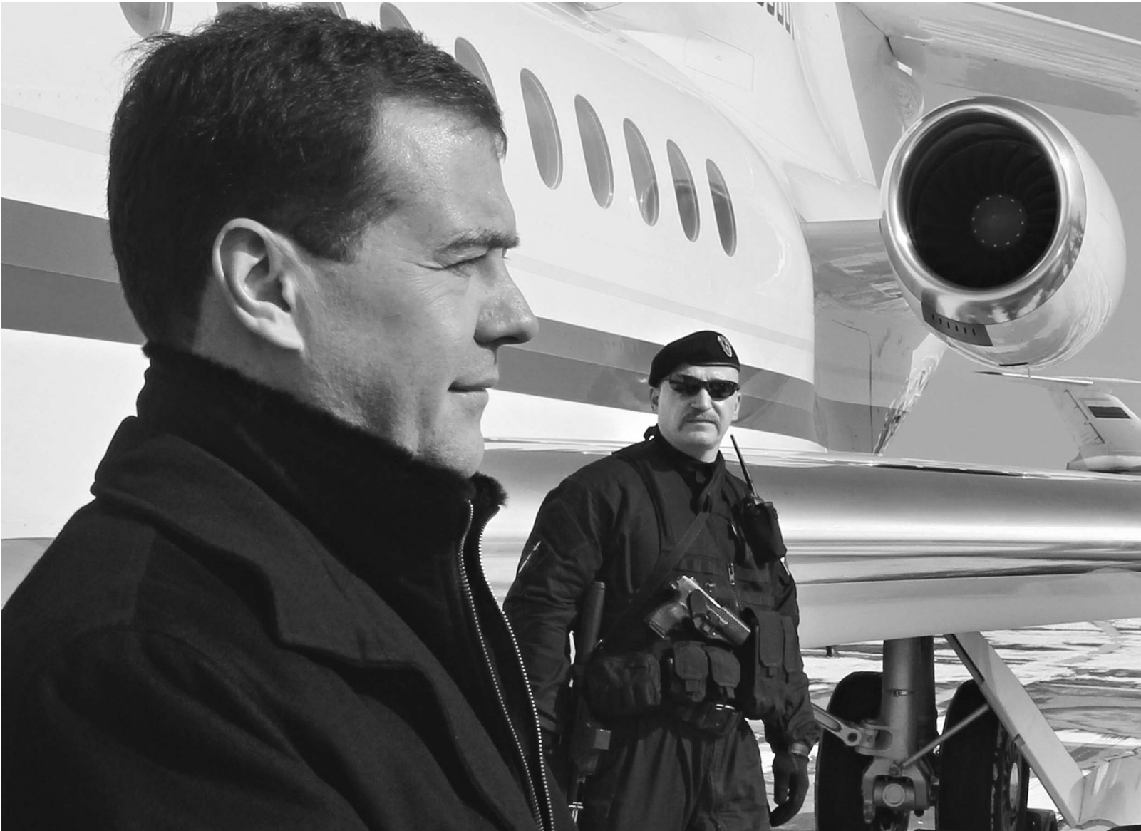
О том, как обезопасить жизнь в Кавказском регионе, Дмитрий Медведев говорил во время своей блиц-поездки в Северную Осетию. ПОДРОБНОСТИ →02

В Приэльбрусье авиаударами и минометным обстрелом обеспечивают покой отдыхающих