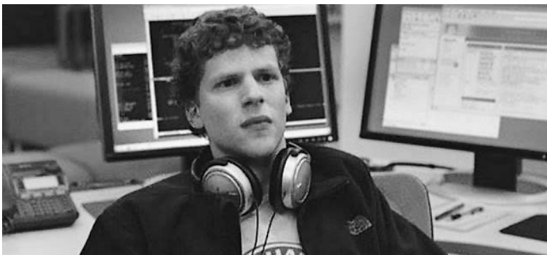
И король Facebook'а Марк Цукерберг (Джесси Айзенберг, «Социальная сеть»)