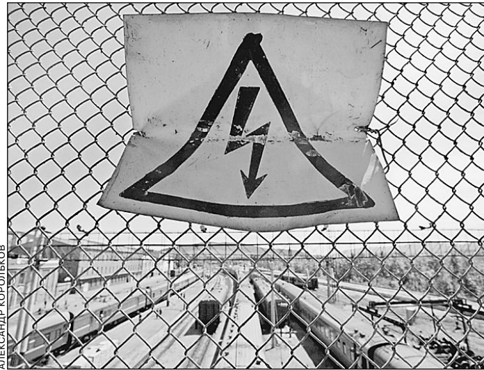
Наш бронепоезд — на особом пути

Отсчет времени до предстоящего десятилетнего юбилея августовских событий пошел на дни: через неделю мы вспомним танки на улицах Москвы, Белый дом, трясущиеся руки членов ГКЧП. Что бы ни говорили скептики, то были великие дни новейшей российской истории. Великие — не в последней очереди потому, что именно тогда Россия окончательно оформилась как самостоятельная страна, как единое государственное тело. Но каков вектор ее будущего развития? Об этом мы задумаемся реже, чем следовало бы. Сегодня этот важный разговор с читателями «Известий» начинает известный экономист, широко мыслящий ученый Виталий Найшуль.