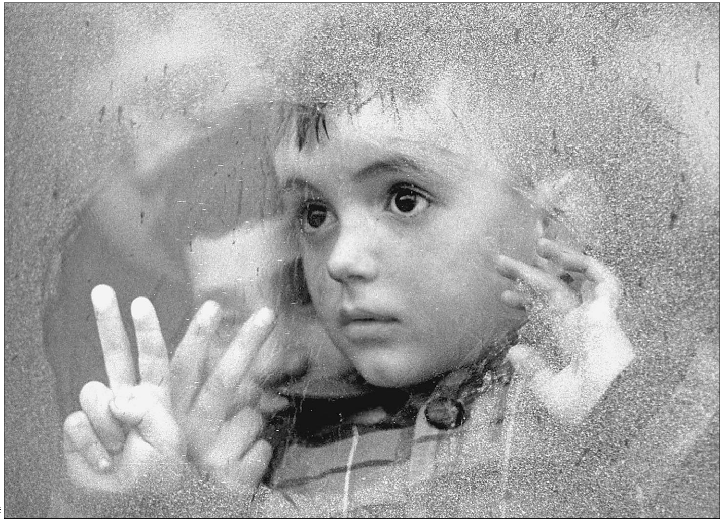
Весь мир — война

Москва — Тель-Авив Продолжение темы на 2-й и 8-й стр.