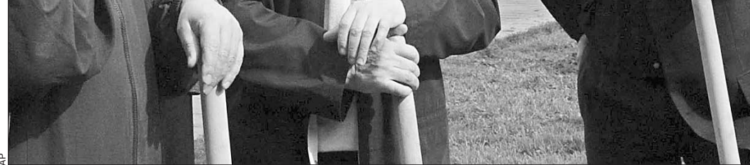
Украина. Спикер Верховной Рады Иван Плющ (слева), президент Леонид Кучма и премьер-министр Виктор Ющенко

Это уже не просто туризм — это экстремальный туризм. Теперь Деннису Тито даже любопытства ради незначителен казаться нос на американском сегменте МКС. На российский сегмент «Заря» и «Звезда», куда ему выпущена космическая виза, все в порядке. Кстати, если выйдет из строя и аварийная американская система, связь с экипажем можно поддерживать через российский сегмент.