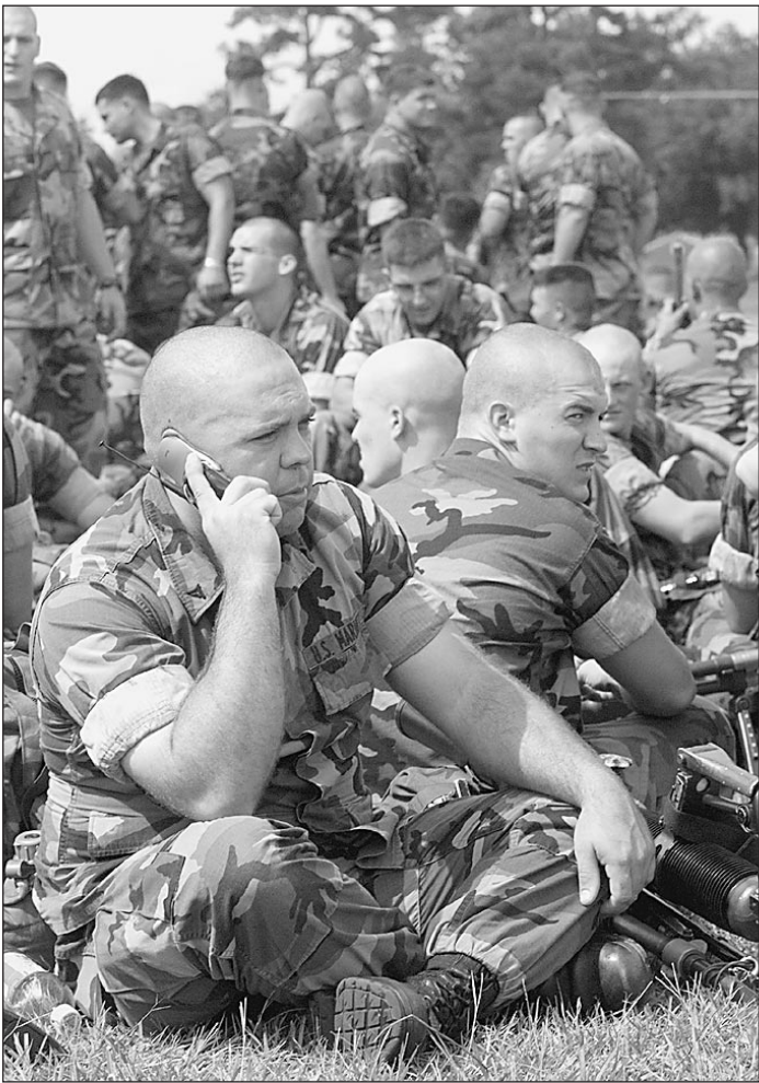
Американская армия к возмездию готова