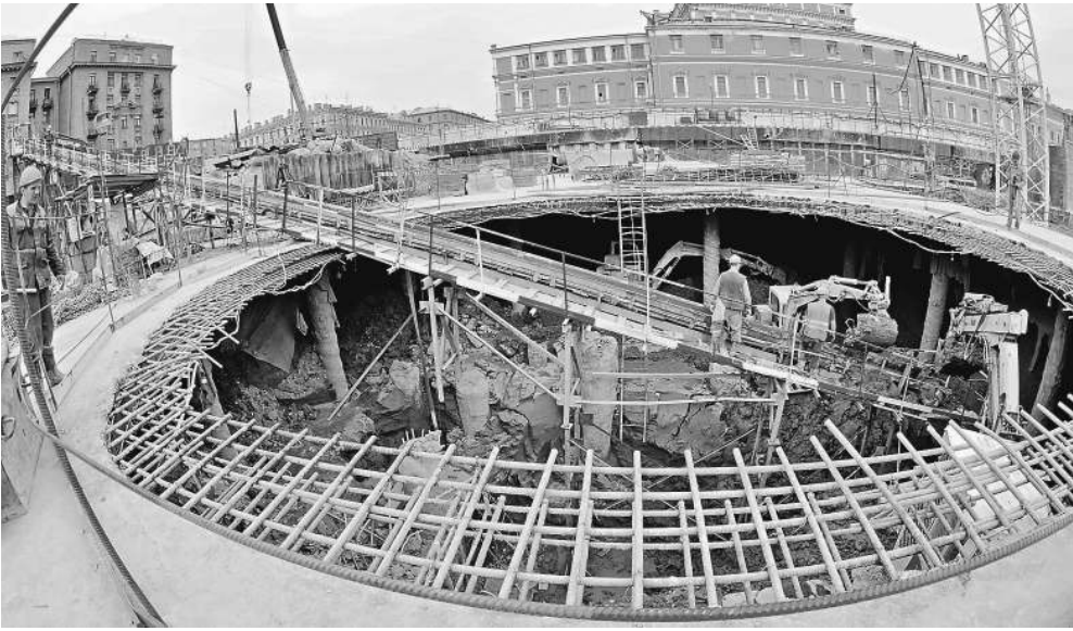
Один из самых значимых долгостроев Петербурга — вторая сцена Мариинского театра — возможно, вскоре будет ликвидирован. Для этого нужно всего 3 млрд рублей и год срока