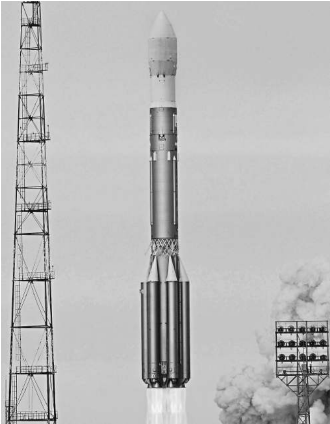
Ракеты будут выводить спутники на орбиту при любом варианте финансирования

DJIA 10809.85 ▼ NASDAQ 2357.69 ▼ MMBV 1466.86 ▼ PTC 1574.41 ▼ НЕФТЬ BRENT 102.8 ▼ ЗОЛОТО 1674.0 ▲ РУБЛЬ/€ 41.9039 ▲ РУБЛЬ/$ 29.4166 ▲