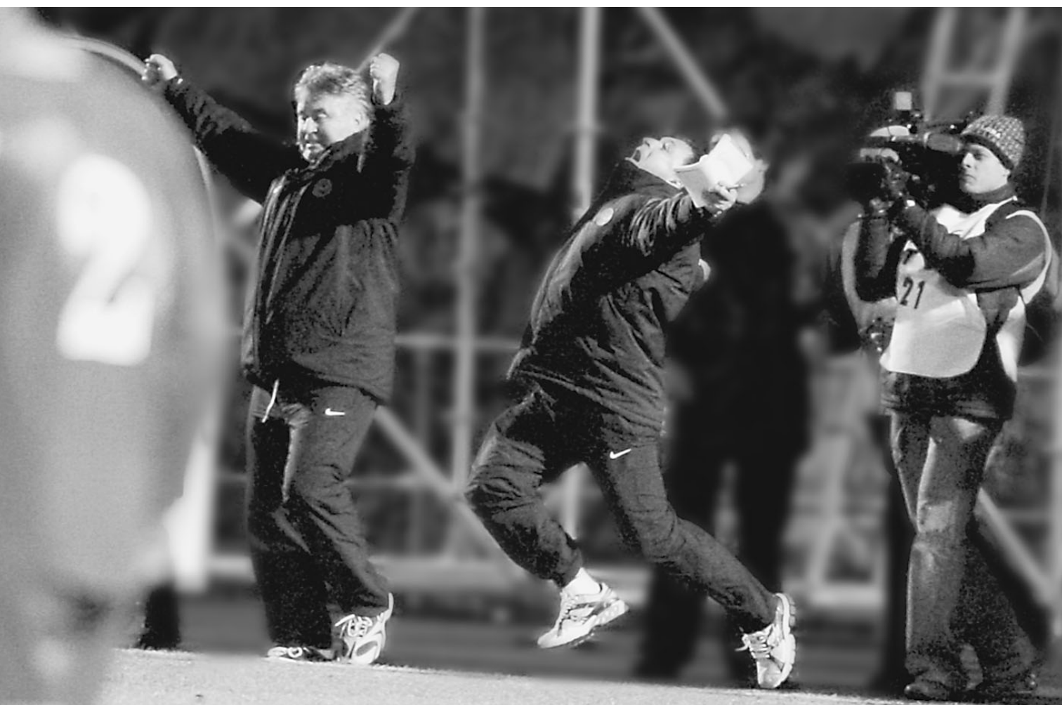
Гус Хиддинг (слева) и вправду везунчик: из группы его команда вышла, будучи в безнадежной ситуации

Разгром братьями-славянами англичан помог нашей инвалидной команде пробраться в финал чемпионата Европы