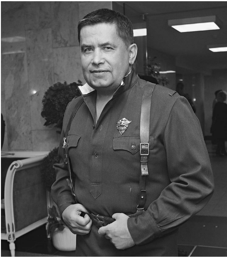
Николай Расторгуев в своем любимом образе комбата

Завтра, в День защитника Отечества, Николай Расторгуев и группа «Любэ» выступят в Кремлевском дворце. А вчера народному артисту России исполнилось 54 года →06