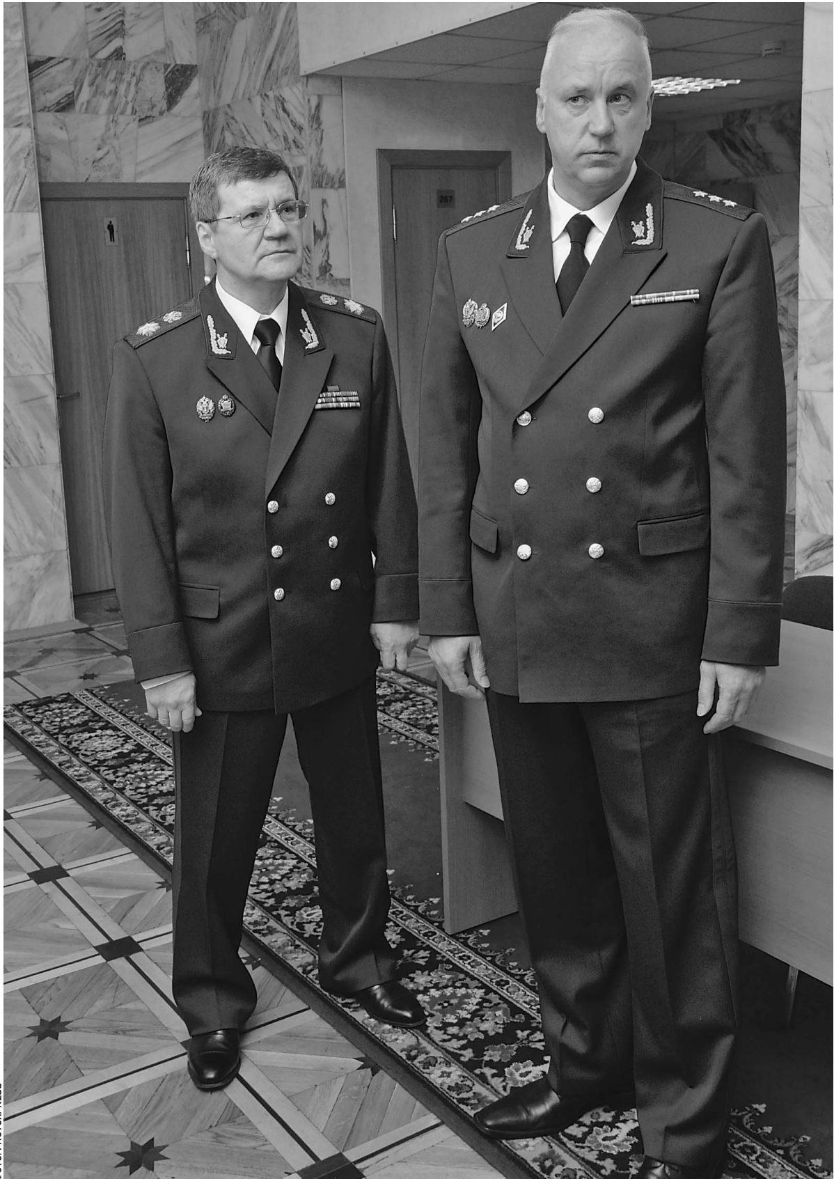
Споры между Генпрокуратурой и Следственным комитетом не должны выходить в публичное поле

Дмитрий Медведев призывает не делать выводов о виновности до приговора суда