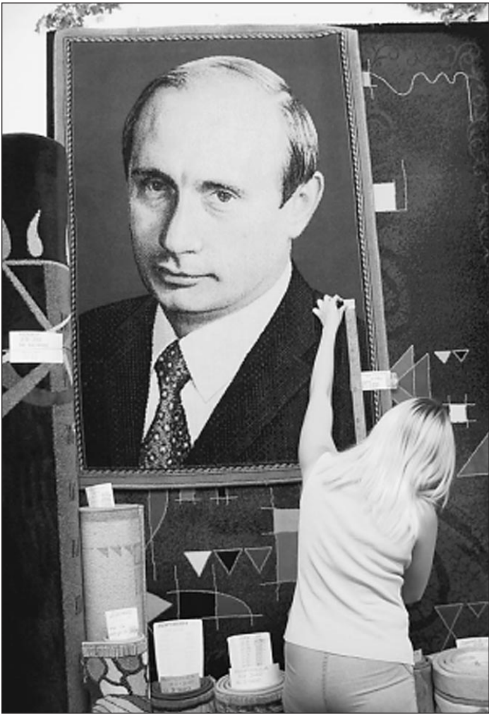
Скромное обаяние главного героя нашего времени