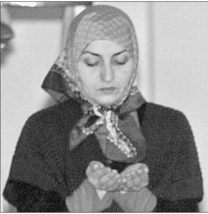
Такая фотография на паспорт в России считается недействительной...