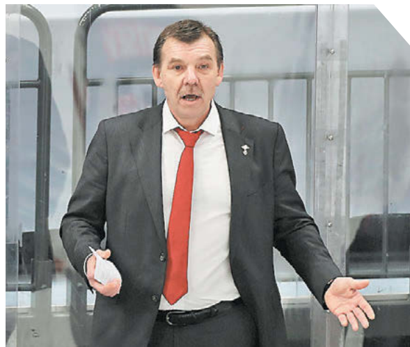
Александр Федоров «СЗ» / Canon EOS-1DX Mark II