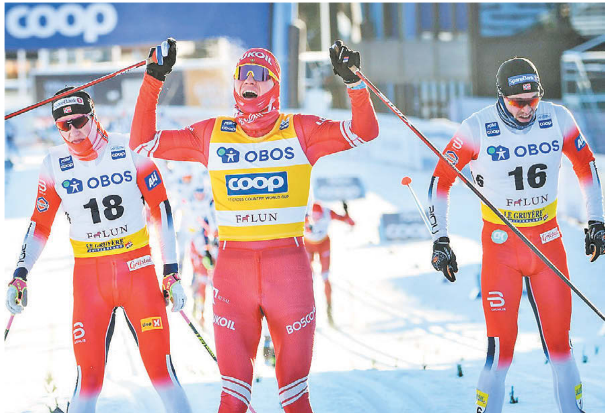
Суббота. Фалун. Александр Большунов (на переднем плане) празднует победу над норвежцами Йоханнесом Клебо и Полом Голбергом