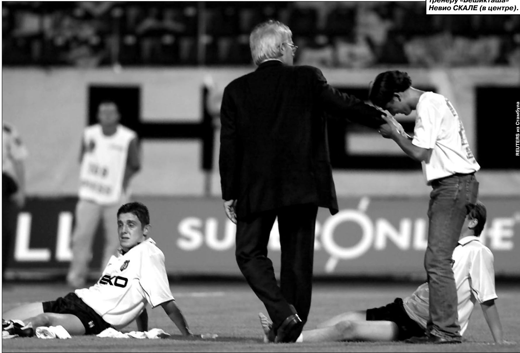
REUTERS из Стамбула

Отчет о матче «Бешикташ» - «Левски», интервью с главным тренером болгарского клуба Владимиром Федотовым - стр. 4