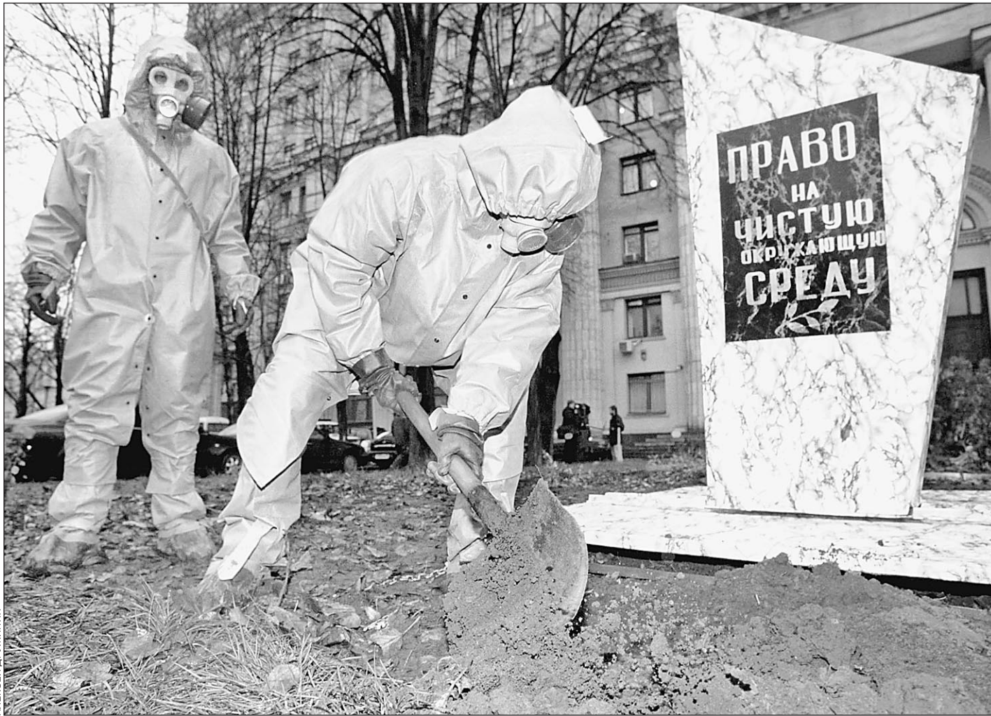
Москва. Осень 2001 года. Экологи протестуют против захоронения в России ядерных отходов

На острове Симушир появится первое в России постоянное хранилище ядерных отходов