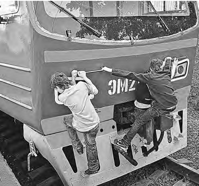
Они тоже не хотели платить за проезд.

Татьяна Шадрин Штраф в тысячу рублей, выход на ближайшем перроне и оплата за уже проделанный путь. Вот что теперь грозит тем, кто решил кататься в электричке бесплатно. В следующем году штрафы могут серьезно повысить, сообщили «РГ» в РЖД. Это предусмотрено концепцией развития пригородных перевозок. Но если вы сели в поезд на перроне, где не работала касса или ее нет, то контролеры возьмут с вас только за проезд. Или вы сможете купить билет на выходе с перрона в конце поездки. Комиссионные за оформление проездного в вагоне или при выходе контролеры в этом случае брать не имеют права. Обязанности разобраться с таким пассажиром возложены теперь на перевозчика. Но если