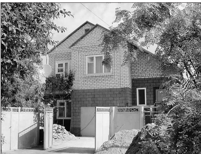
Тот самый прокурорский особняк