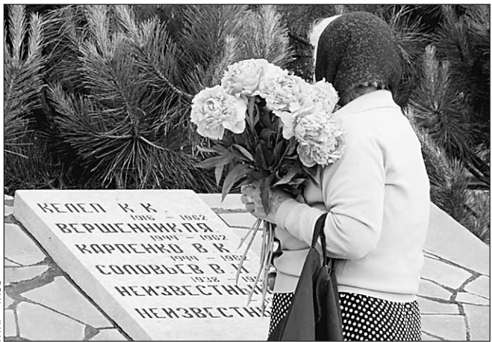
2 июня. В Новочеркасске почтили память жертв трагедии 1962 года