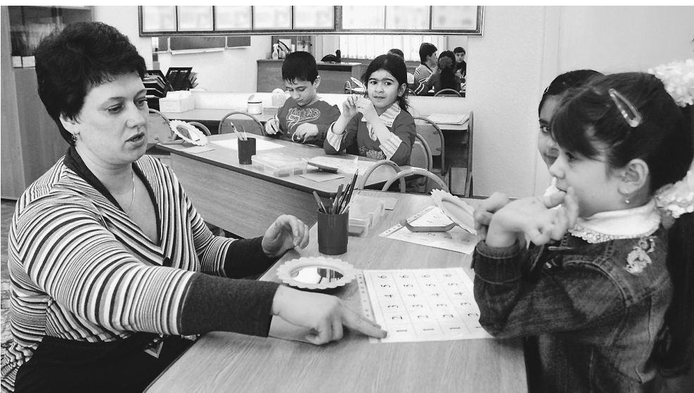
Неродной русский должен стать хотя бы «рабочим»