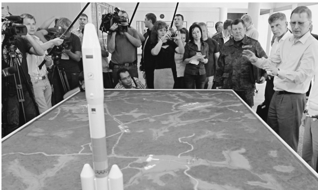
Собственный космодром России необходим как можно скорее

Хруничевские «Протоны» — едва ли не самое доступное сред-