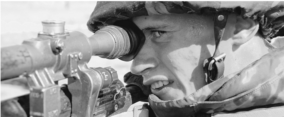
Хороший снайпер — продукт штучный