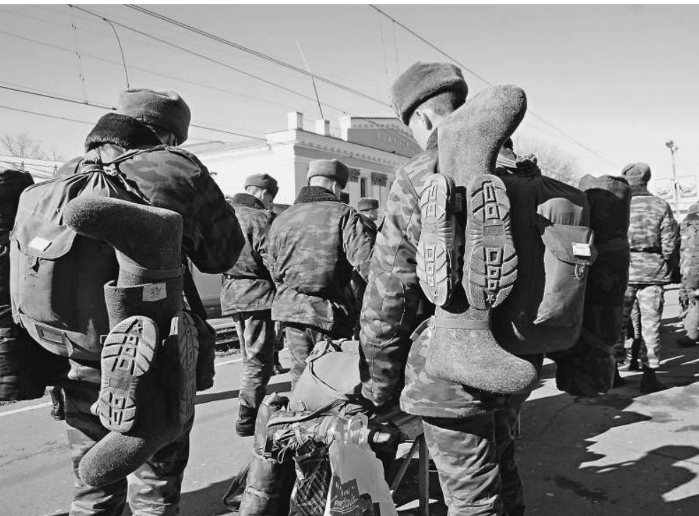
Пережить русскую зиму без советских валенок Российская армия не может