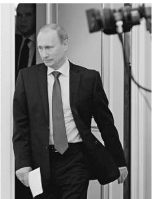
Рабочий график премьера — не секрет для журналистов из Германии

Фильм не затронет личную жизнь премьера: его посвятят исключительно профессиональ-