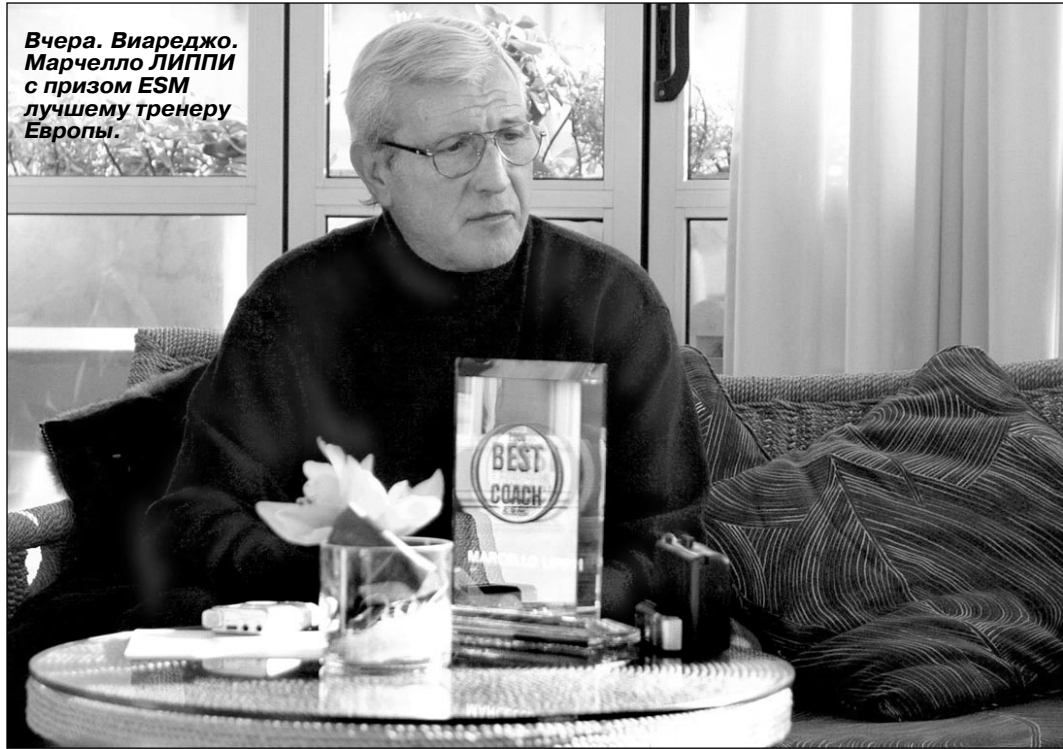
Вчера. Виареджо. Марчелло ЛИППИ с призом ESM лучшему тренеру Европы.