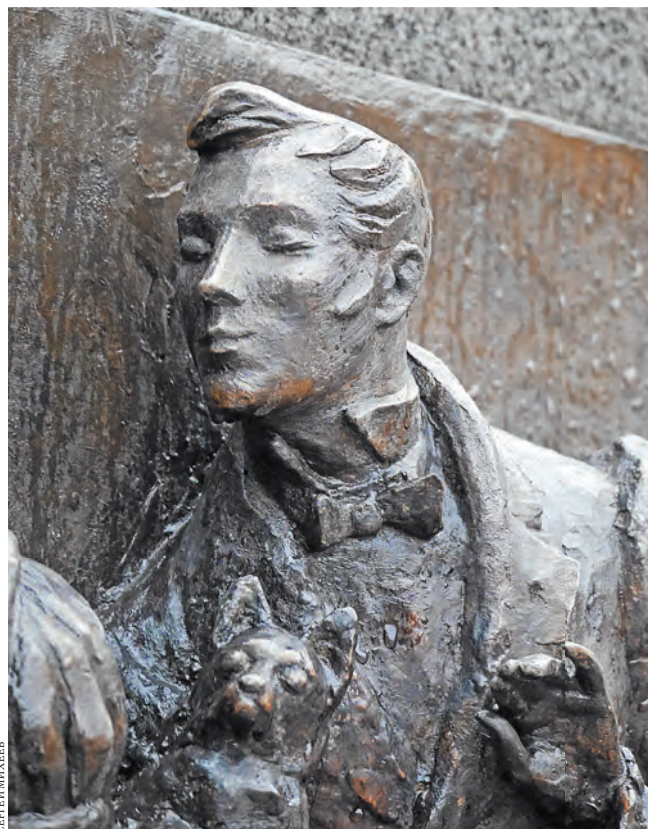
На барельефах памятника Александру Грибоедову, который находится на Чистых прудах в Москве, изображены герои его бессмертной комедии «Горе от ума».