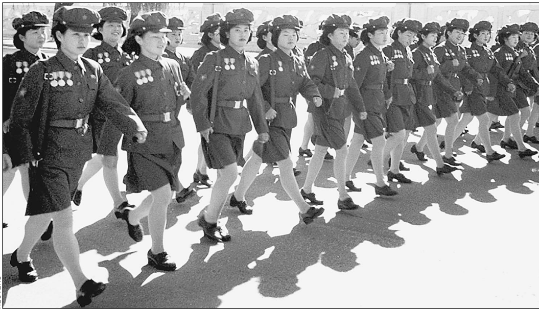
Высокий дух важнее высоких технологий

Розничная цена в России и странах СНГ свободная