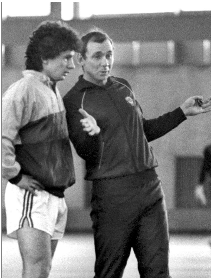
Январь 1989 года. Москва. Манеж «Спартак». Первая тренировка Олега РОМАНЦЕВА в качестве главного тренера «Спартак».

Уже 12 дней как Олег Романцев - не главный тренер «Спартак». Даже у самых впечатлительных болельщиков красно-белых начало проходить состояние конца света. Извержение вулкана страстей завершилось.