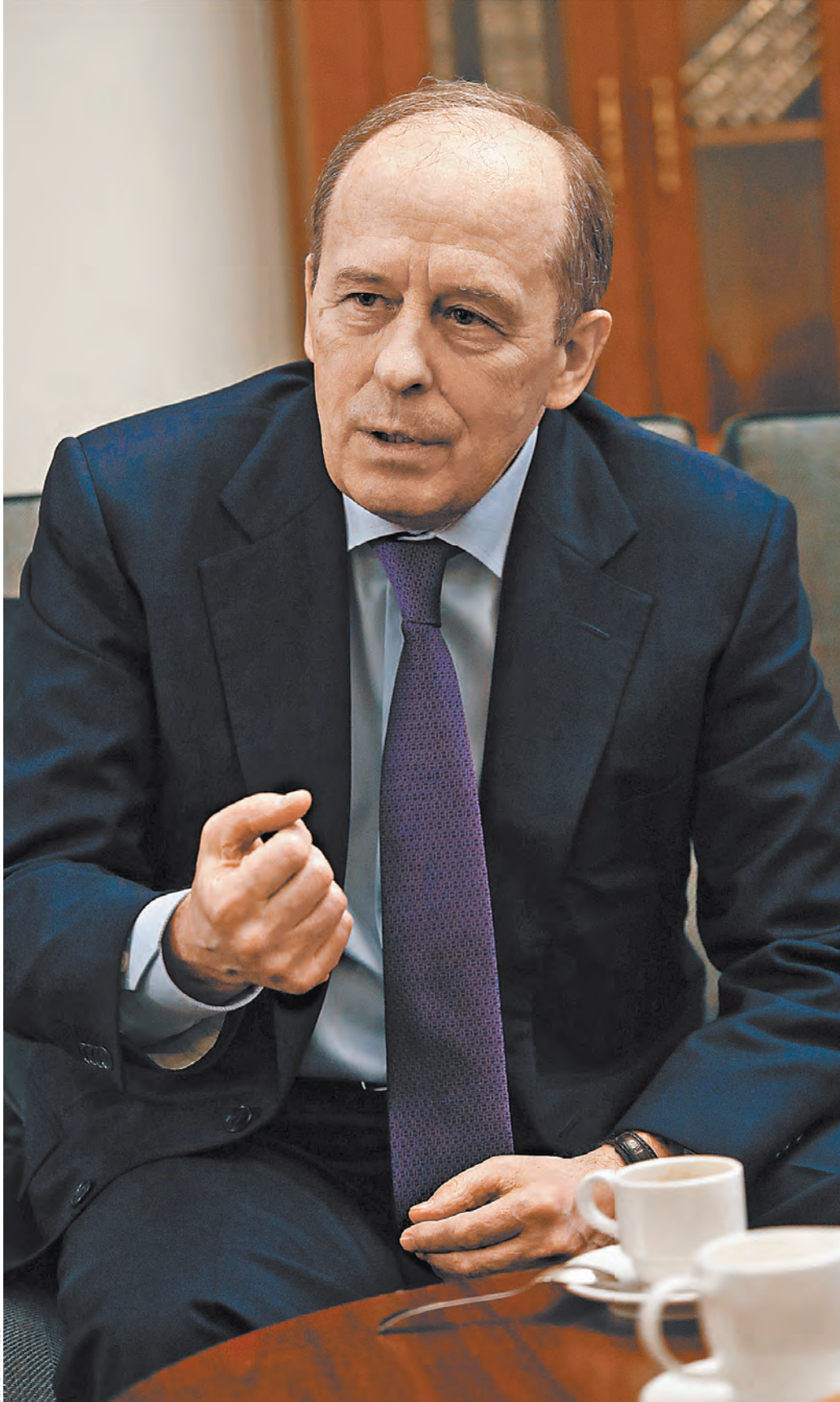
Александр Бортников: За последние 10 лет в России не допущено около 200 терактов. Очевидно, речь идет о тысячах спасенных жизней.

В результате к «нулевым» годам Российская Федерация одной из первых в мире столкнулась с таким явлением, как международный терроризм. С 1990 по 2006 год в нашей стране было совершено более 70 жесточайших терактов: подрывы жилых домов, самолетов и поездов, массовые захваты заложников, бандитские рейды по регионам страны. Погибли свыше 1,6 тыс. мирных граждан, а также около 400 сотрудников спецслужб и правоохранительных органов. И террористическая активность продолжала нарастать. Без преувеличения ска-