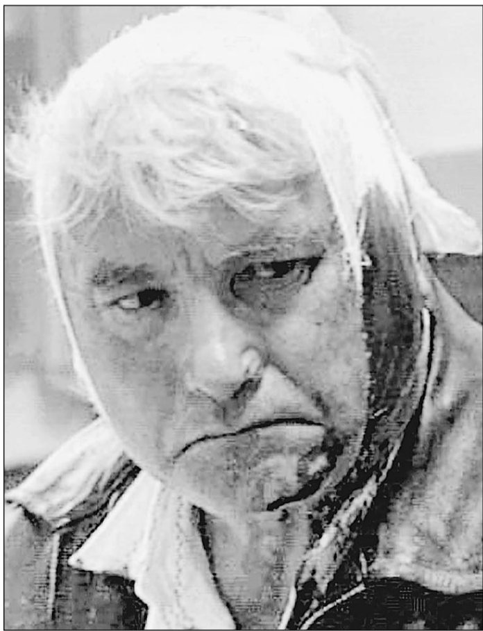
За что? Один из пострадавших от теракта в Минводах

Бандиты вербуют кровавых исполнителей в соседних регионах