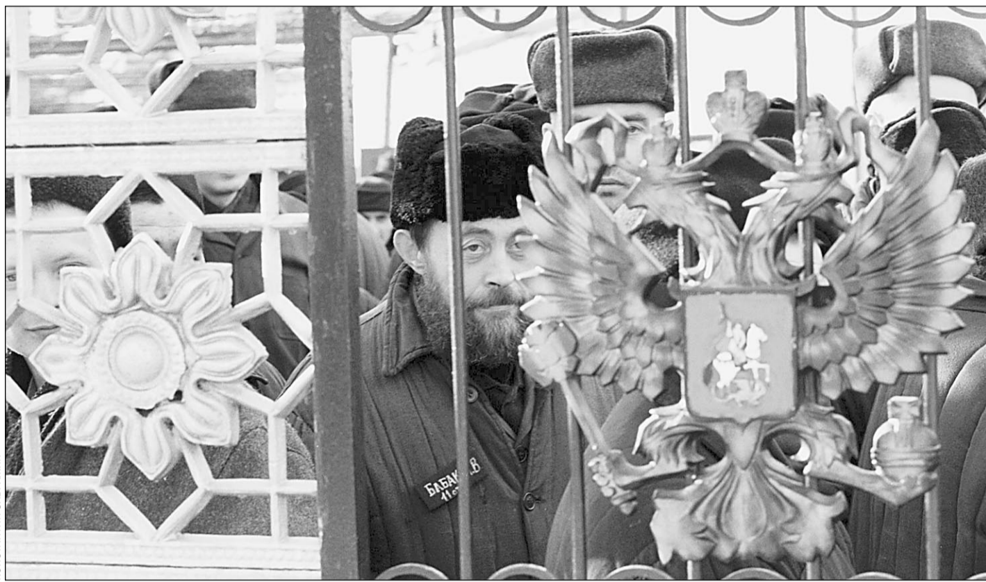
Правосудие — за решеткой

Еще предстоит решить, что делать с Уголовно-процессуальным кодексом. Этот вопрос станет темой завтрашнего совещания Путина с председателями судов, генпрокурором, руководителями ФСБ, Налоговой полиции и Минюста. УПК был принят в первом чтении еще четыре года назад, но так и застрял в парламентских кабинетах. По думским