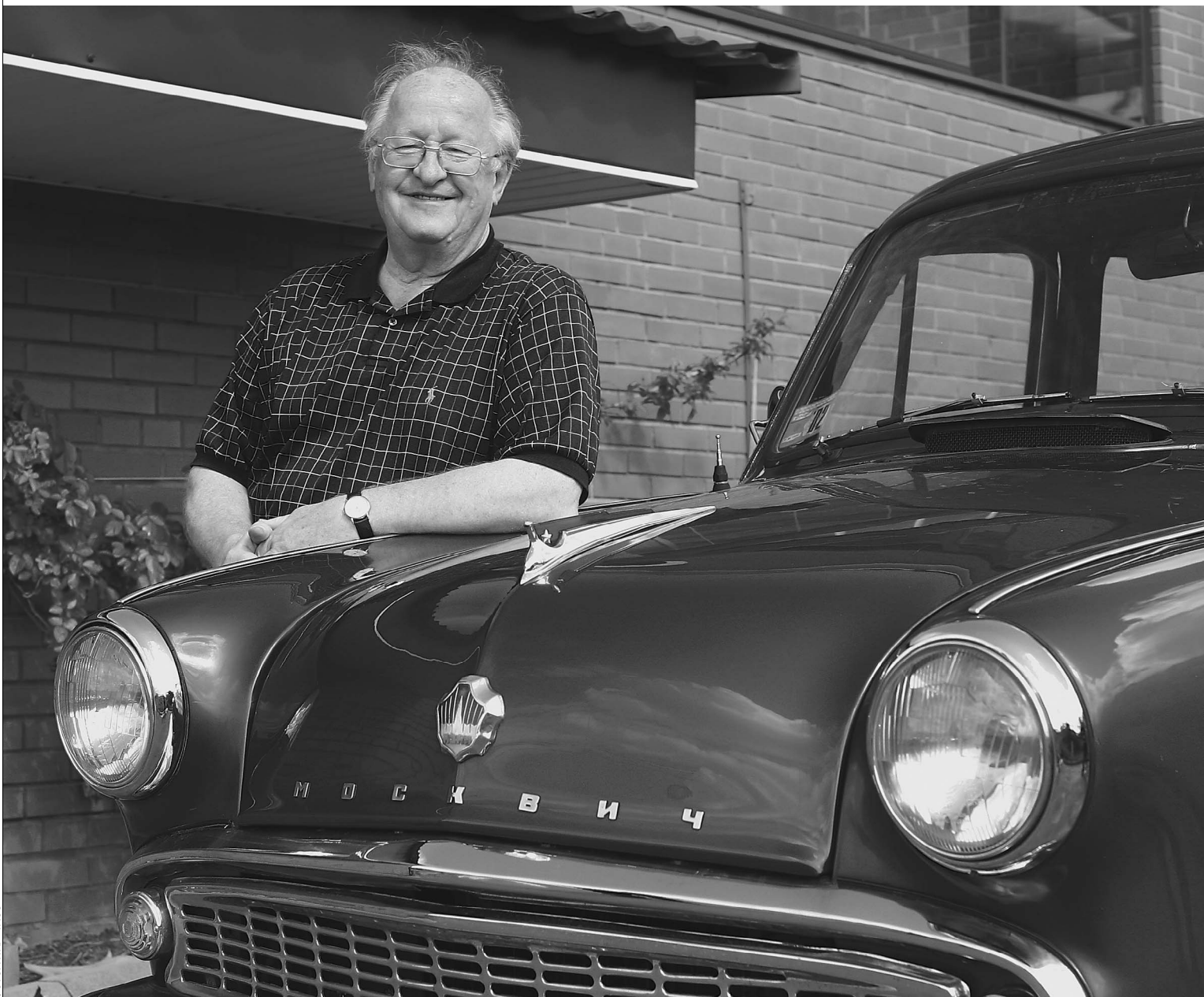
Виктор Геращенко — один из самых известных российских пенсионеров. Чтоб все так жили!

Со следующего года средняя пенсия вырастет на 46%, и в России не останется пенсионеров, которые получали бы меньше прожиточного минимума. Но это только половина дела. В ближайшие годы средняя пенсия превысит 2,5 прожиточного минимума и заметно «перекроет» показатели СССР. Деньги на это возьмут в том