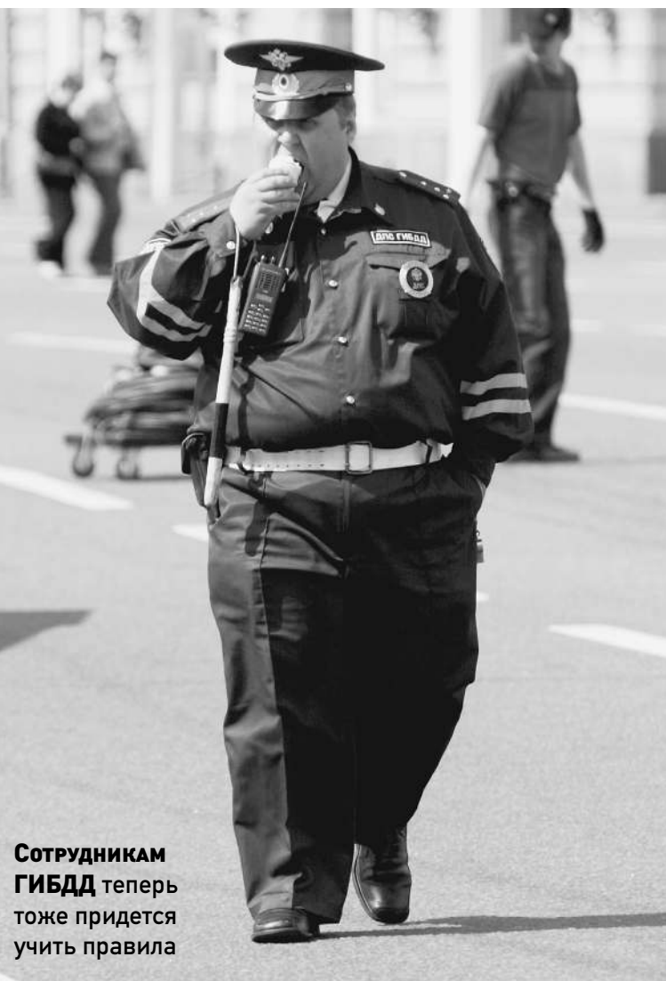
Сотрудникам ГИБДД теперь тоже придется учить правила

Дума ужесточает наказание для тех, кто лихачит на дорогах