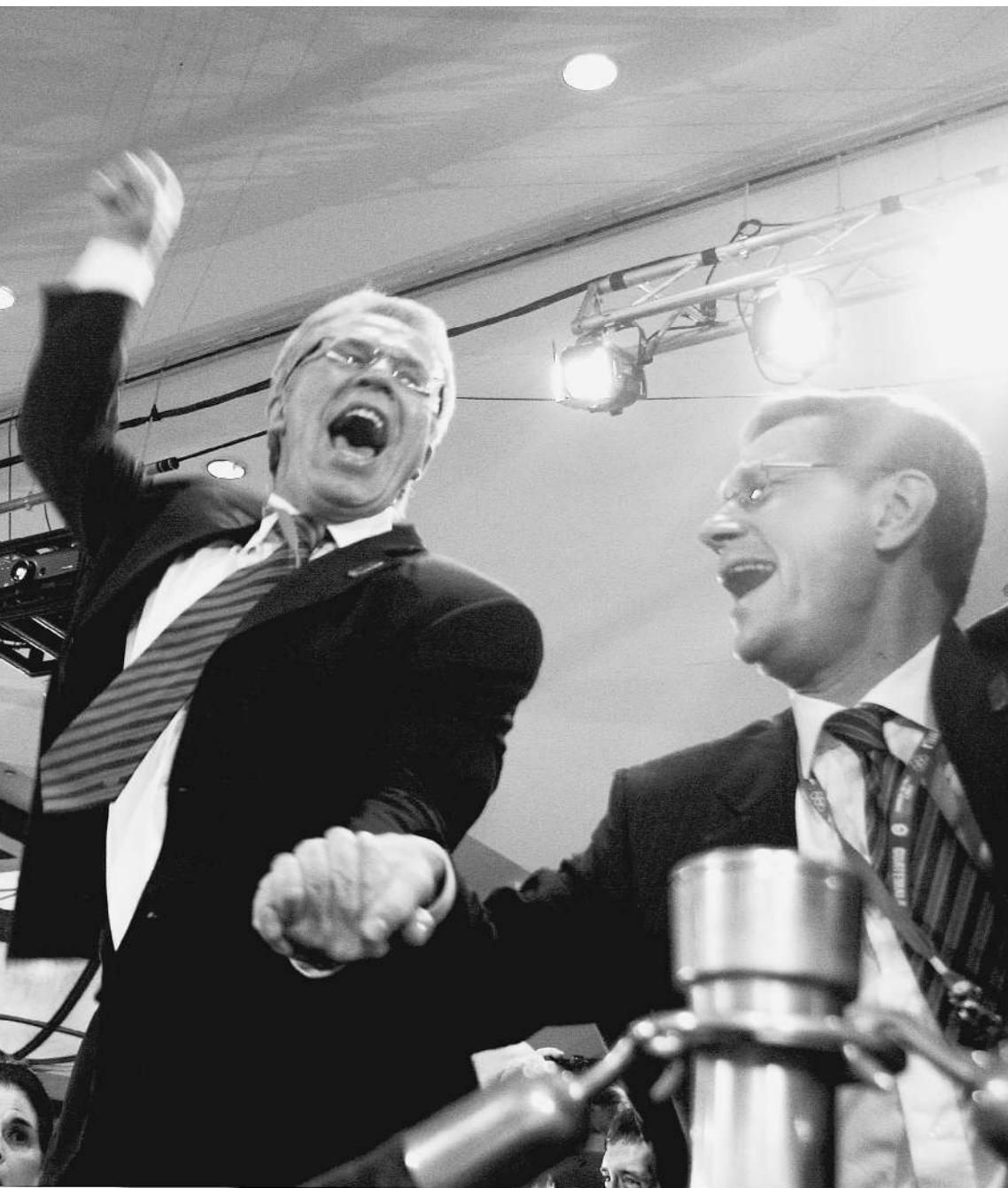
Вычеслав Фетисов и Александр Жуков: нет слов, одни чувства

Эту победу ждали, на нее надеялись, и все равно она оказалась в чем-то неожиданной. На публике члены российской делегации излучали уверенность, но в кулуарах признавали: шансы Пьончанга чрезвычайно высоки. Оттого и ликование даже самых серьезных и обычно застегнутых на все пуговицы чиновников было столь бурным и непосредственным. За тем, как тянулись последние часы перед голосованием, и за тем, каким был российский триумф в Гватемала-Сити, наблюдали корреспонденты «Известий».