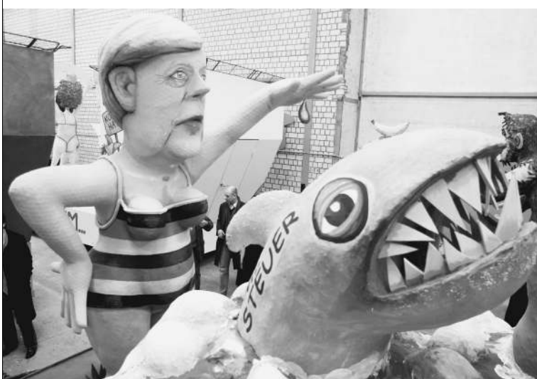
Канцлер Германии Ангела Меркель готова выстраивать отношения с Москвой по-новому

По мнению германского правительства, наша страна имеет гигантские запасы валюты, которые могут позволить нам купить стратегически важные компании — «голубые фишки» немецкого фондового рынка. «Мы стараемся выработать защитные меры, которые уже существуют в США», — пояснил представитель правительства Германии Ульрих Вильгельм. → стр. 8