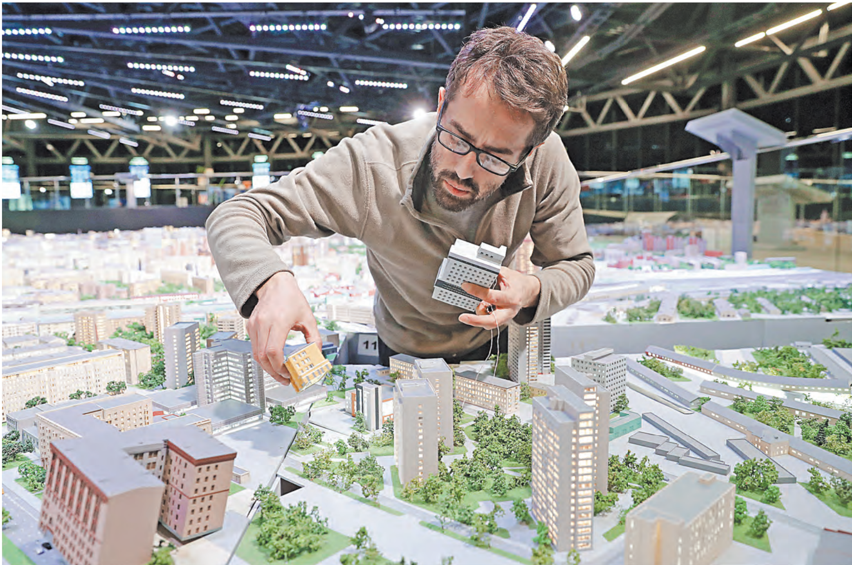
Ажиотажный спрос на жилье начался после запуска программы ипотеки с господдержкой в апреле прошлого года.