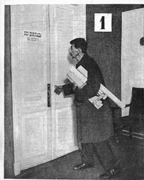
ДВЕРИ ДОЛЖНЫ РАСПЯТЫСЯ

Первый номер журнала «ИЗОБРЕТАТЕЛЬ» открывает статья Альберта Эйнштейна «Массы вместо единиц», где великий ученый говорит, что время гениальных изобретателей-одиночек прошло, наступает замечательная эпоха коллективного изобретательства. В этой январской книжке новорожденного издания блистательный подбор авторов. Со статьями выступают крупные государственные и партийные деятели — В.Куйбышев, Л.Каменев, замечательные писатели — М.Пришвин, В.Шкловский, Н.Погодин, знаменитый журналист М.Кольцов, академики, выдающиеся инженеры и простые рабочие. Печатается бюллетень важнейших государственных решений по изобретательским делам, в том числе о привилегиях, помогавших тогдашним изобретателям жить и заниматься творчеством.