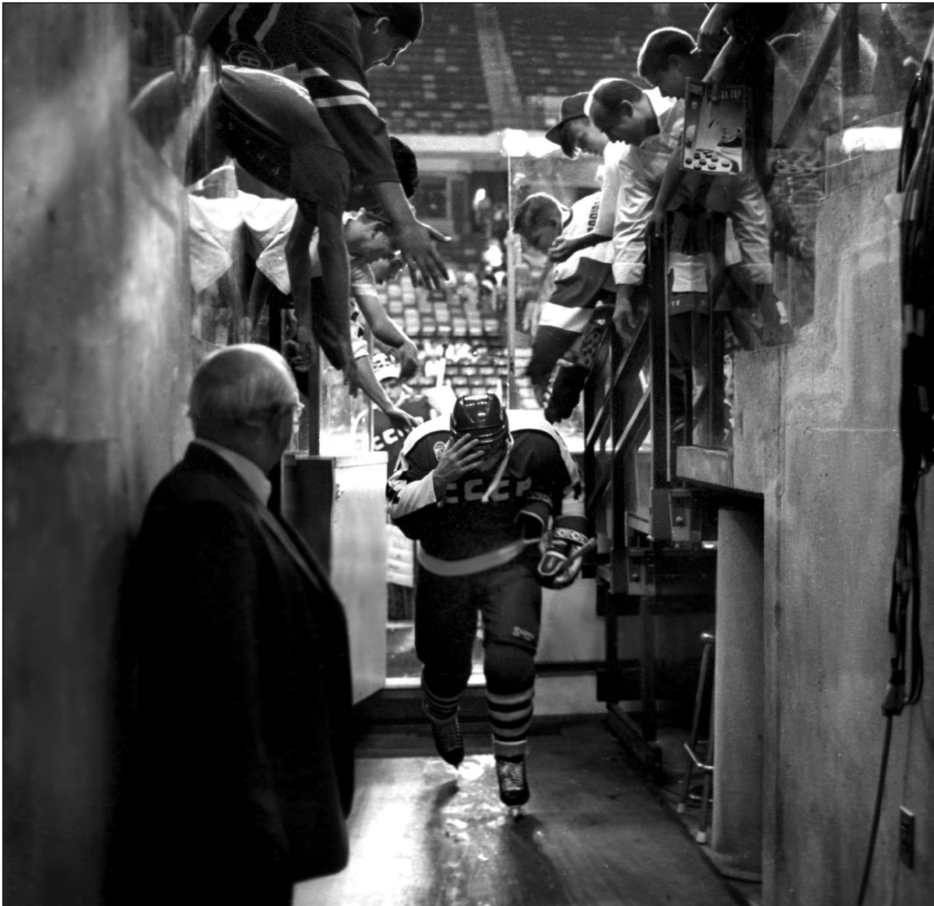
1991 год. Торонто. Так - кто вслепую, кто полулегально, а кто нелегально - в конце 80-х - начале 90-х уходили в НХЛ наши первые хоккеисты. И кто в те времена мог подумать, что когда-то для них откроется обратный путь - в Россию.