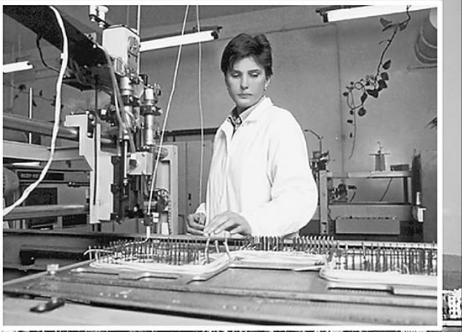
Здесь находится Уральский электрохимический комбинат, где была сделана начинка для первой советской атомной бомбы, реакторное топливо для подлодок, для АЭС. Это самое большое в мире разделительное производство, где гексафторид урана, который привозят с других комбинатов атомного царства, доводят до нужной степени обогащения. По технологической сложности в длинной этой цепочке обогащение производство считается наиболее изощренным. 24 сотрудника комбината стали лауреатами Ленинской премии, Государственных премий здесь под полсотни. На комбинате внедряли свои идеи корифеи науки — академики Курчатова, Соболева, Бочвар, Миллионщиков, Виноградов, Фрумкин, Тананаев, Фридляндер...