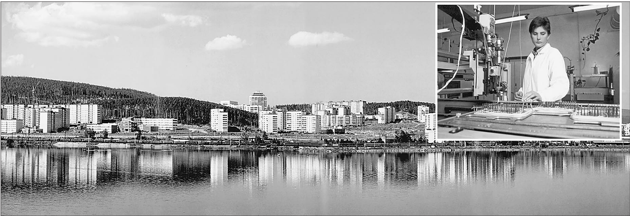
Новоуральск. «Замок на холме». Так выглядит советский рай в постсоветской России

● ЦИТАТА ДНЯ «Над чем бы ни работал ученый, в результате всегда получается оружие». Автор неизвестен