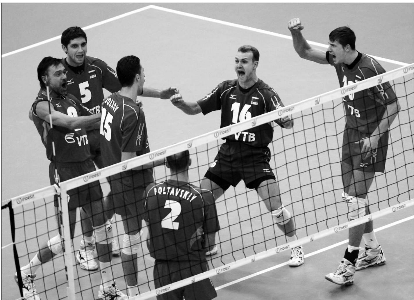
Вчера. Москва. Россия - Италия - 3:2. Наша сборная - в полуфинале!