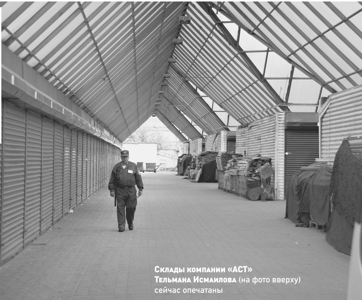
Склады компании «АСТ» Тельмана Исмаилова (на фото вверху) сейчас опечатаны

6 тысяч контейнеров с контрабандными товарами на 2 миллиарда долларов были обнаружены на Черкизовском рынке столицы. Среди контрабанды — детские товары, опасные для здоровья. Черкизовский рынок контролирует Тейман Исмаилов — миллиардер, устроивший недавно в Турции «вечеринку века» в собственном дворце-отеле. «Известия» выяснили сенсационные подробности этого громкого дела.