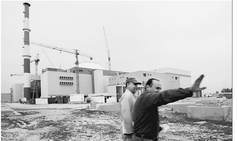
Бушерская АЭС пока в надежных русских руках

Дмитрий Соколов-Митрич, Сергей Капtilкин / фото Едва ли подписание российско-иранского договора о возвращении в Россию отработанного ядерного топлива положит конец политическим спекуляциям на этой теме. Слишком много усилий было потрачено на создание из Бушерской АЭС одного из главных элементов «оси зла», чтобы теперь расстаться с этой картой в международной политической игре. О том, как выглядит бушерский атом вблизи и почему он так пугает американцев, — репортаж «Известий», которые стали первой из российских газет, чьим корреспондентам удалось побывать на самом секретном объекте Ирана. В конце минувшей недели Европейский суд по правам человека (ЕСПЧ) в Страсбурге удовлетворил три первые жалобы жителей Чечни. Суд признал их пострадавшими от действий федеральных сил в ходе вооруженного конфликта. Россия признана нарушительницей статьи 2 Европейской конвенции по правам человека — «нарушение права на жизнь». В решении говорится, что рос-