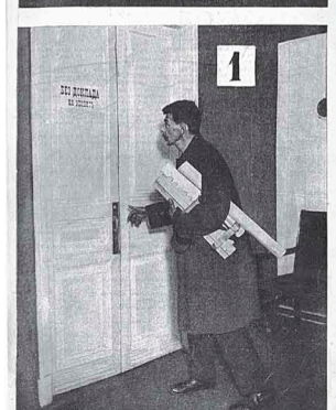
Двери должны распахнуться

Первый номер журнала «ИЗОБРЕТАТЕЛЬ» открывает статья Альберта Эйнштейна «Массы вместо единиц», где великий ученый говорит, что время гениальных изобретателей-одиночек прошло, наступает замечательная эпоха коллективного изобретательства. В этой январской книжке новорожденного издания блистательный подбор авторов. Со статьями выступают крупные государственные и партийные деятели — В.Куйбышев, Л.Каменев, замечательные писатели — М.Пришвин, В.Шкловский, Н.Погодин, знаменитый журналист М.Кольцов, академики, выдающиеся инженеры и простые рабочие. Печатается бюллетень важнейших государственных решений по изобретательским делам, в том числе о привилегиях, помогавших тогдашним изобретателям жить и заниматься творчеством.