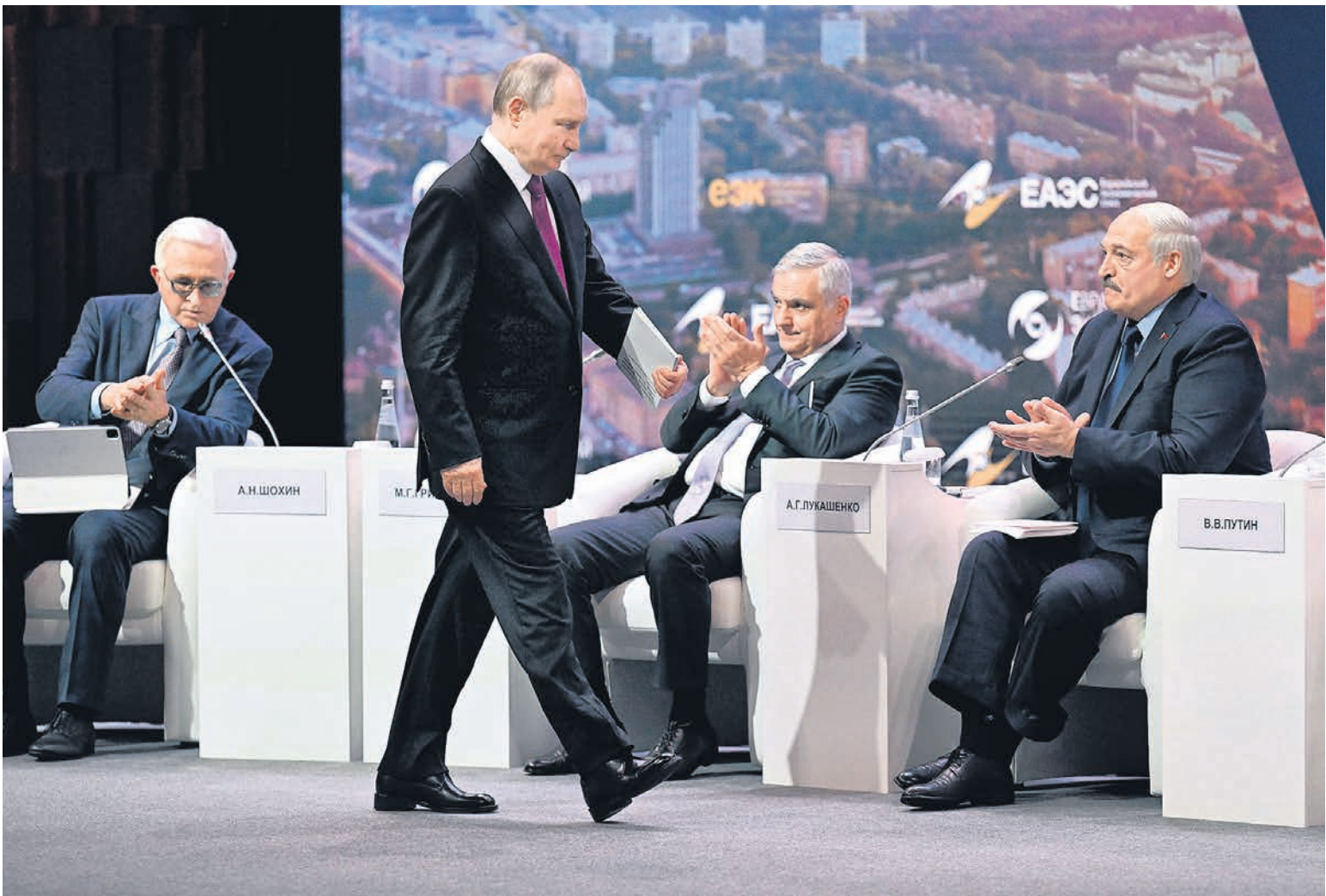
Владимиру Путину на сцене аплодировали даже больше, чем в зале

А здесь он ждал президента Белоруссии Александра Лукашенко, президента Казахстана Касым-Жомарта Токаева, президента Киргизии Садыра Жапарова и вице-премьера правительства Армении Мгера Григоряна. Сам премьер-министр Армении, как и президент Азербайджана, должен был быть в Москве на следующий день, когда намечалось заседание Высшего совета Евразийского экономического союза (ЕАЭС).