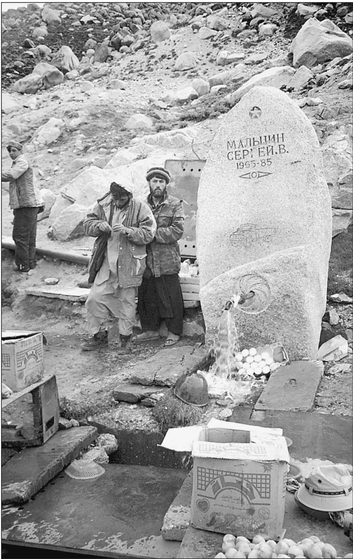
Памятник советскому солдату на перевале Саланг