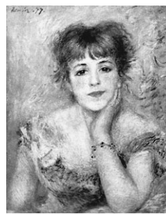
Олег Ренуар. «Портрет актрисы Жанны Самари»