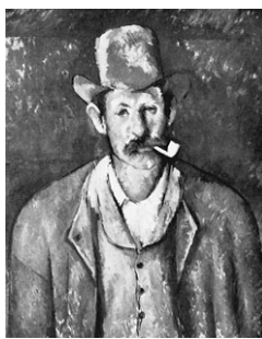
Поль Сезанн. «Мужчина, курающий трубку»