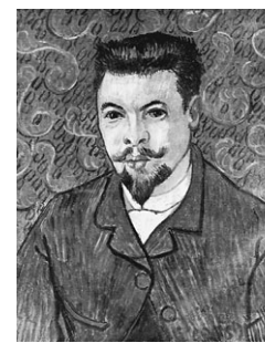
Ван Гог. «Портрет доктора Рэя»

КАКИЕ ШЕДЕВРЫ ЗАДЕРЖАЛИ В ШВЕЙЦАРИИ ..... → стр. 2 КТО ЕЩЕ ПЫТАЛСЯ АРЕСТОВАТЬ КАРТИНЫ ЗА РУБЕЖОМ ..... → стр. 2 «СУД ВИНУЖДЕН БУДЕТ ПРИНЯТЬ ДРУГОЕ РЕШЕНИЕ» — МНЕНИЕ БОРИСА БОЯРСКОВА, РУКОВОДИТЕЛЯ РОСОХРАНКУЛЬТУРЫ ..... → стр. 2