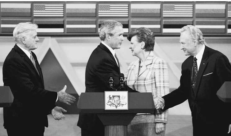
Президенты Литвы, Латвии и Эстонии надеются, что Америка им поможет

Очевидно: конечная цель — «давить» Россию. Если иски действительно станут массовыми, не обращать внимания на них Москва уже не сможет. Прецедент есть: многочисленные иски евреев к Германии в судах США в конечном итоге заставили немецкое правительство начать платить компенсации. → стр. 3