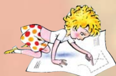
Сюжеты на вкладки