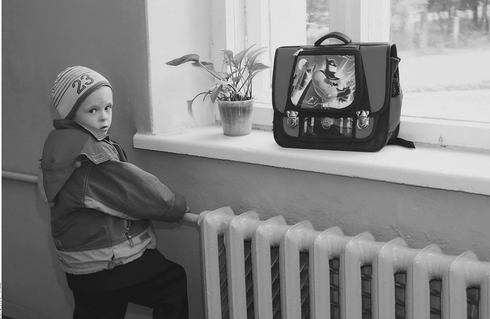
Тяжелые портфели можно будет разгрузить лишь с помощью электронных учебников. Но большинству школ до этого пока далеко

Роспотребнадзор утвердил новые нормативы для школ