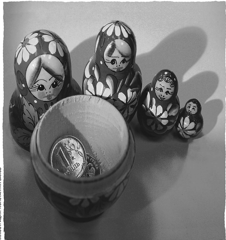
ИЛЛЮСТРАЦИЯ КОНСТАНТИНА ВАЛОВА