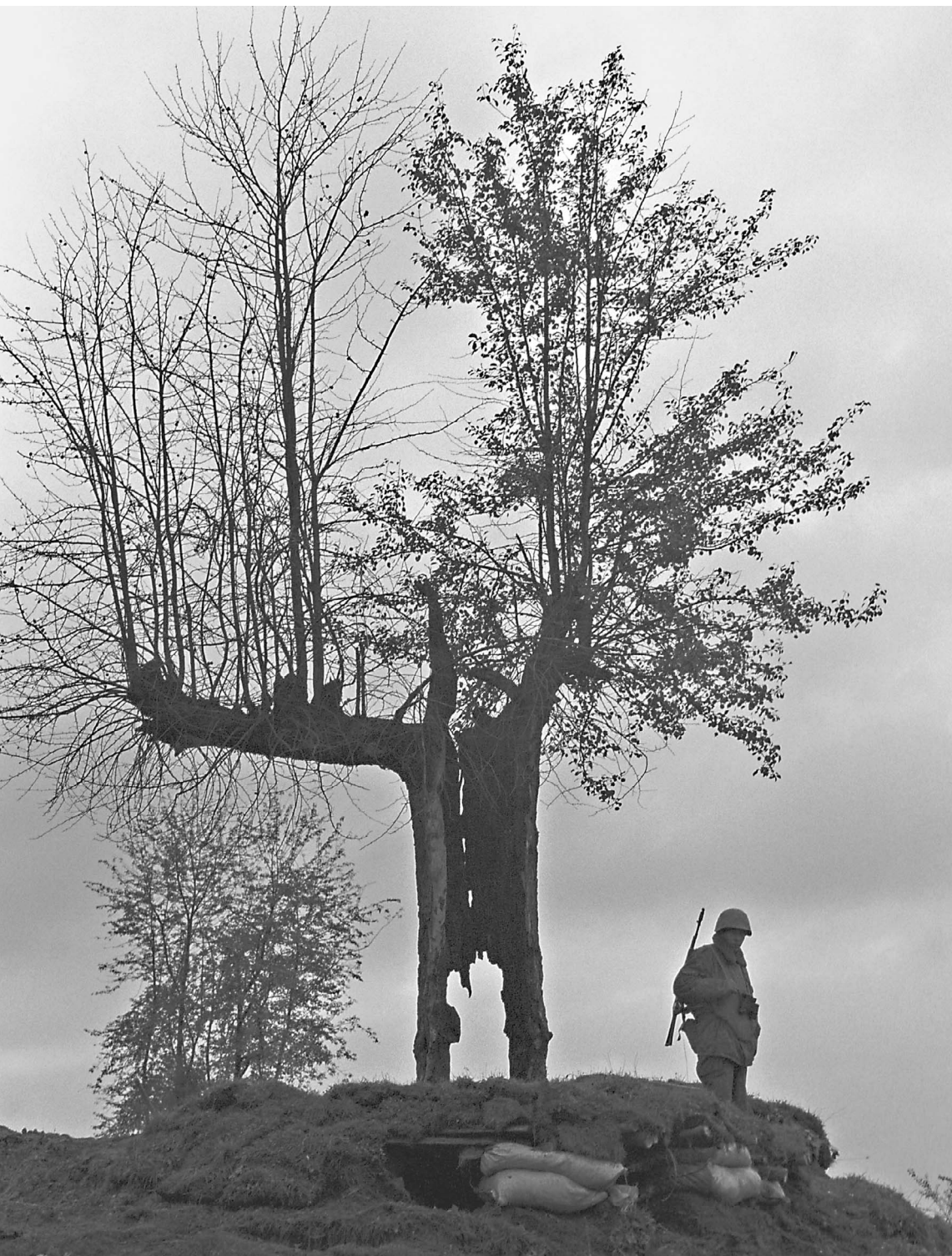
«ДЕРЕВО ВОЙНЫ». Блокпост в Веденском районе. Окрестности села Киров-Юрт. 2000 год

В Чечне завершена антитеррористическая операция